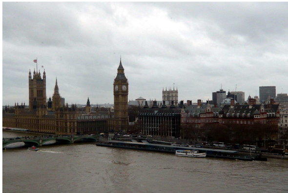
House of Parliament