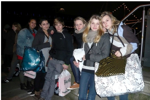
SchülerInnen des 9. Jahrgangs