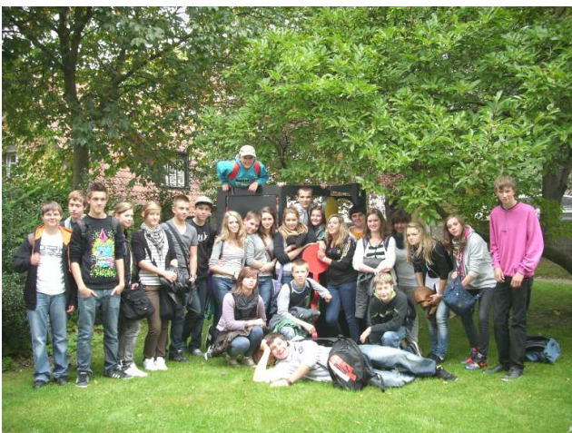
Die Teilnehmerinnen und Teilnehmer des diesjährigen Austauschs

Viel Spaß hatten die Jugendlichen natürlich auch in ihrer Freizeit. In der Familie fanden am Wochenende zahlreiche Ausflüge statt und auch am Nachmittag traf man sich zum Bowlen oder zum Schwimmen.