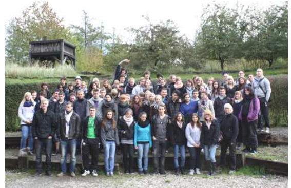
Unser 11. Jahrgang im Wildwald

Schon vor den Sommerferien in den Brückentagen sind wir zum Möhnesee gefahren und am Donnerstag, den 13.10.11, ging es zu einer Exkursion in den Wildwald Vosswinkel, um die Klassengemeinschaft zu stärken, die Teambereitschaft, das Vertrauen und das Miteinander zu fördern. Hierzu trafen wir uns um 8.30 Uhr an der Hannah-Arendt Gesamtschule. Angekommen im Wildwald Vosswinkel, gingen die jeweiligen Klassen mit einem Waldpädagogen in den Wald, wo wir als Klassengemeinschaft mehrere Aufgaben bewältigen mussten. Unter anderem war es eine Herausforderung, eine Murmel durch mehrere offene Rohre, die von den Schülern aneinander gehalten werden mussten, zu balancieren. Das Schwierige daran war, dass das am Hang des Waldes geschehen musste, also mit Gefälle und über eine vorgegebene Strecke. Wir wuchsen über uns hinaus und bewältigten eine noch längere Strecke als vorgegeben. Nebenbei wurden wir über verschiedene Verhaltensweisen der Tiere im Wald informiert. Besonders im Vordergrund stand der Hirsch, denn im Herbst ist die Brunftzeit.