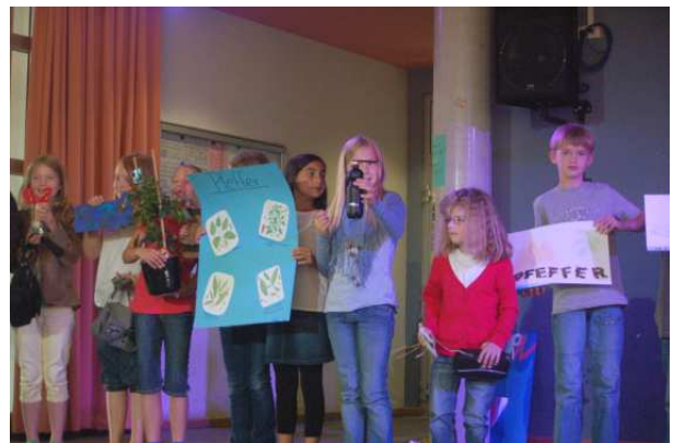
Die Klasse 5.2 mit selbstkreierten „Peffersymbolen“

Die Symbole des jetzigen fünften Jahrgangs sind Gewürze: Salz, Pfeffer, Paprika und Chili, sie sollen die richtige „Würzmischung“ zum erfolgreichen Lernen beisteuern. Als Vorbereitung auf das Kennenlernfest sind die neuen Schülerinnen und Schüler in einem Brief gebeten worden, ihr Klassensymbol mitzubringen. Es ist immer wieder eine Freude zu sehen, welche Kunstwerke die Schülerinnen und Schüler kreieren.