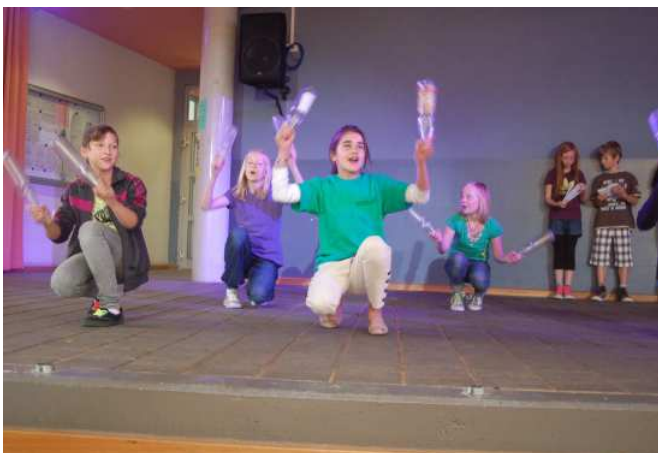
Begrüßungsaktion des „alten“ 5. Jahrgangs

Es beginnt mit einem ca. 30 min. Programm in der Mensa, das von den Schülerinnen und Schülern und Lehrerinnen und Lehrern des bestehenden fünften Jahrgangs vorbereitet und durchgeführt wird.