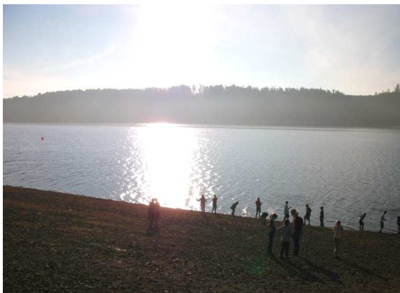
Spielen am Sorpesee