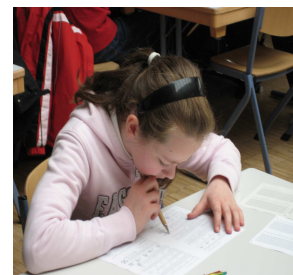
Volle Konzentration auf die Aufgaben